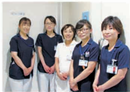
外来看護スタッフ

泌尿器科特殊外来とは、CIC (Clean Intermittent Catheterization : 間歇的自己導尿)、ウロマスターやパッドテストなど、主に排尿障害や失禁のある患者さんを対象に、特殊処置の治療や指導を行います。排泄ケアは人間の尊厳に関わり、QOL (クオリティオブライフ…生活の質) にも大きく影響します。