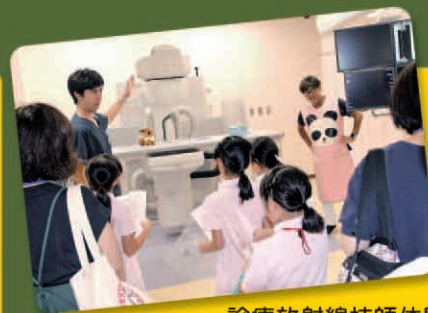
診療放射線技師体験