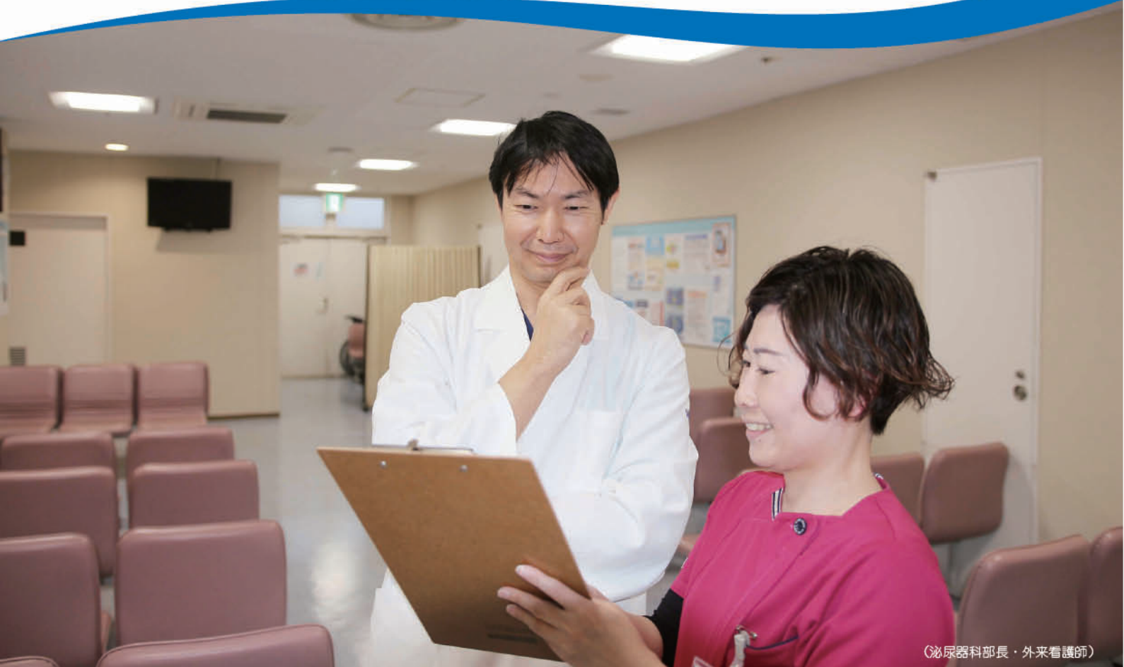
(泌尿器科部長・外来看護師)